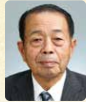
曾於市商工会会長