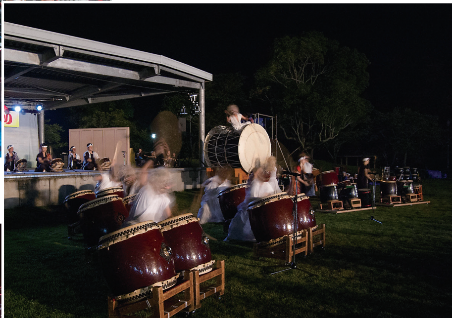
ふるさと大隅祭り 7月29日