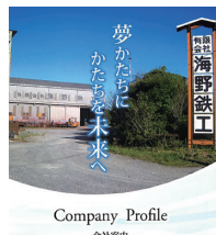
Company Profile — 会社案内 —

当社は、商工会の支援を通じて平成26・27年度ものづくり事業の採択を受け鉄鋼溶接ロボット、形鋼切断機を導入し、大幅な業務効率化を実現するとともに、経営力向上計画も経済産業省のお墨付きで認定。また、国の小規模事業者持続化補助金も活用する等、今後も事業拡大が期待されます。