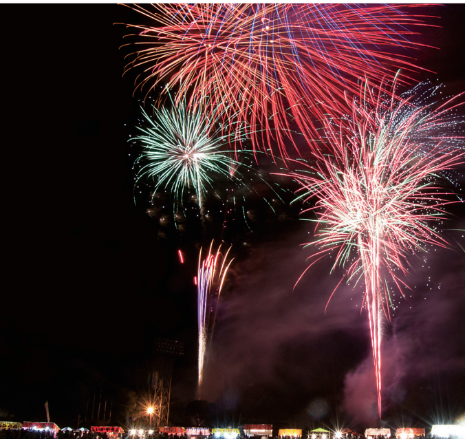
すえよしサマーフェスタ 8月22日