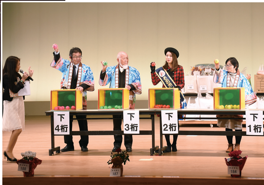
新春お楽しみ抽選会 1月6日